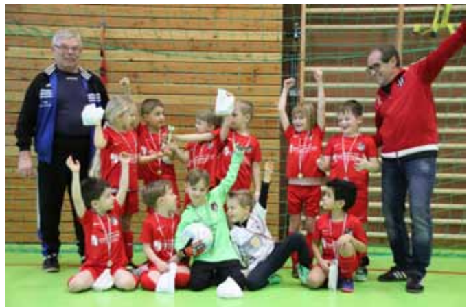
... so sehen Sieger aus ...

Für die Saison 2018/2019 wurde ein Arbeitskreis gebildet, um zu prüfen ob und unter welchen Voraussetzungen das Hallenturnier wieder „auferstehen“ könnte. Ein motiviertes Team aus aktiven Spielerinnen der Damenmannschaft, der Jugendleitung sowie der Alten Herren konnte gewonnen werden und so machte man sich im Septem-