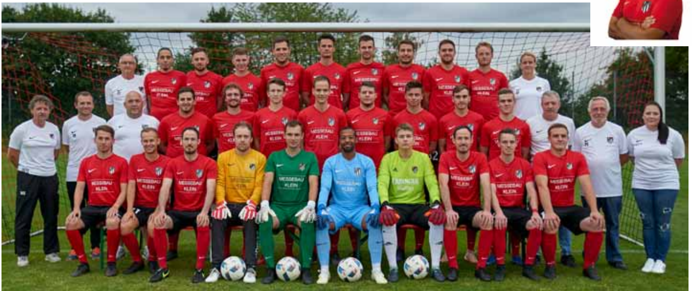
SC SCHWARZACH 1