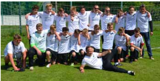
U15 am „Meister-“Spieltag