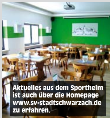
Aktuelles aus dem Sporthaus ist auch über die Homepage www.sv-stadtschwarzach.de zu erfahren.